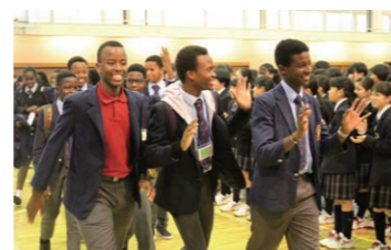
ケニアのラウンドスクエア加盟校との交流