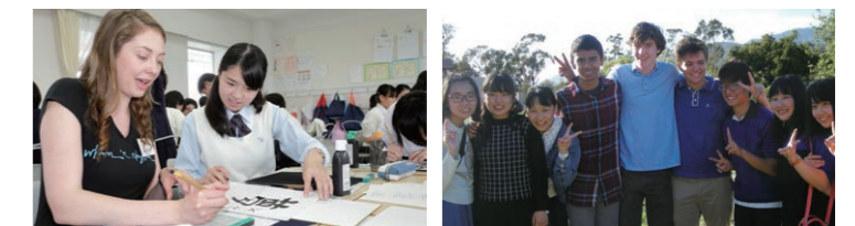
アメリカの名門・エール大学(Yale University)との交流 本校の姉妹校で全米トップクラスのエリート校・ケイトスクール(Cate School)との交流

中学3年次のアメリカ海外研修(2週間)、高校1年次の3か月語学留学プログラムに加え、1年間の留学プログラムを新設します。