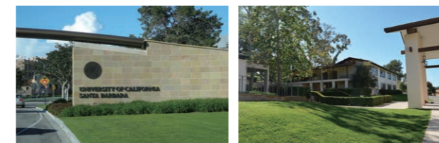
UCSB(カリフォルニア大学サンタバーバラ校) ケイトスクール(Cate school)

中学3年次に全員が2週間、アメリカ・カリフォルニア州の本校の施設「八雲レジデンス」を拠点に研修を実施。期間中はUCSB(カリフォルニア大学サンタバーバラ校)での授業を中心に、姉妹校であるケイトスクールや地元の学校との交流も深めます。